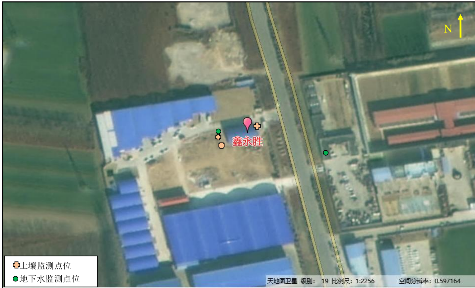
附图 1 土壤地下水监测点位图